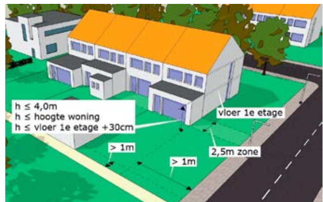
Binnen de 2,5 meter zone

Als er door de bouw van een bijbehorend bouwwerk een ruimte ontstaat die de 2,5 meter zone overschrijdt, dan geldt voor die gehele ruimte de eis van een ondergeschikt gebruik. Alleen als de ruimte binnen of ter hoogte van de 2,5 meter zone wordt afgescheiden met een scheidingsconstructie (muur of pui), kan de ruimte gebruikt worden voor de uitbreiding van de primaire functie van het hoofdgebouw, bijvoorbeeld als woonkamer.