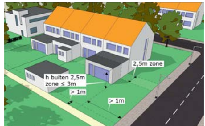
Buiten de 2,5 meter zone

Vinden de werkzaamheden plaats aan een monument of in een door het Rijk aangewezen beschermd stads- of dorpsgezicht dan kunt u in aantal gevallen toch vergunningvrij bouwen. Neem hiervoor contact op met uw gemeente of doe de vergunningcheck op www.omgevingsloket.nl .